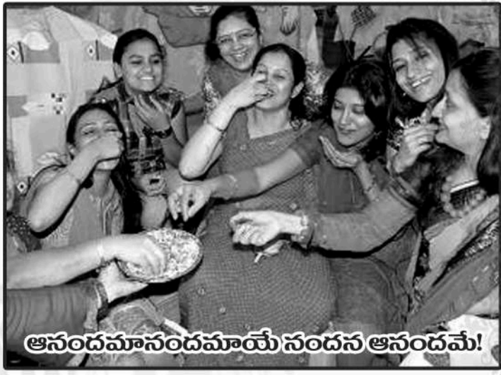
ఆనందమానందమాయే నందన ఆనందమే!

ఉగాది అంటే ప్రకృతి, సృష్టి పుట్టిన రోజు. బ్రహ్మకల్పం ప్రారంభమైనప్పుడు తొలిగా పుట్టిన సంవత్సరం 'ప్రభవ' తొలి మాస చైత్రం, తొలి ఋతువు వసంతం, తొలి తిథి పాడ్యమి, తొలి రోజు ఆదివారం, తొలి నక్షత్రం అశ్వని. అదే మాసం నవమి తిథినందు, పునర్వసూ నక్షత్ర ఘడియలో సకల ధర్మపరుడు, ప్రజాభీష్టపు ధర్మ రాజ్యాధినేత శ్రీరామచంద్రుడు జన్మించాడు.