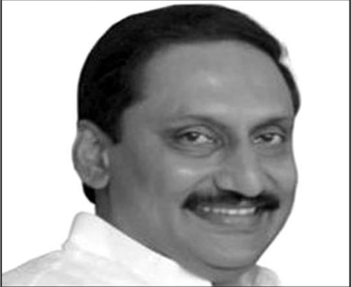
విశ్వసిస్తున్నాం. జలగం వెంకటరావు గారి పట్టుదల కనిపిస్తుంది. కానీ మద్రాసులో ఎందరో తెలుగువారున్నారనీ, రాజకీయంగా రాష్ట్రంతో విడివడినా కళాసాహితీ రంగాల ఘనులున్నారని గ్రహించండి. ఇక్కడ ఆంధ్రులు ప్రవాసులు కాదని గుర్తించండి.

ఆయన అసమర్థుడు కాదు, గంట గంటకూ వస్తున్న గండాలను ఎదుర్కొంటున్న ధీశాలి. కాంగ్రెస్ లోని బహు నాయకత్వం, వెన్నుపోటులూ సహజమే! కానీ, ఇవి కిరణ్ కుమార్ రెడ్డికి అనుభవం లేనివి. ఎన్నో మంచి పనుల్లో, ప్రజా సంక్షేమం కోసం, కాంగ్రెస్ అధిష్టానం మెప్పులు పొందిన వై.యస్.రాజశేఖరరెడ్డి సేవలను మరిచిన రాజకీయ పాలక, ప్రతిపక్షాల పావుల్లో నలిగిపోతున్ననూ, కిరణ్ కుమార్ రెడ్డి నెట్టు(గ్గు)కు వస్తూ, ప్రపంచ తెలుగు మహాసభలపై దృష్టి నిగిడ్చి, విశ్వసనీయులైన అమాత్యులూ, అధికారుల తోడ్పాటుతో సభలను దిగ్విజయంగా నిర్వహించగలరని