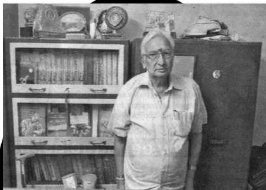
గ్రంథమే ఆయన సొంతం

మలేషియాలోని రవాంగ్ రాష్ట్రంలో ఓ వీధిలోని