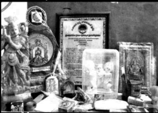
గోటేటి అండుకున్న అవార్డులు, పురస్కారాలు