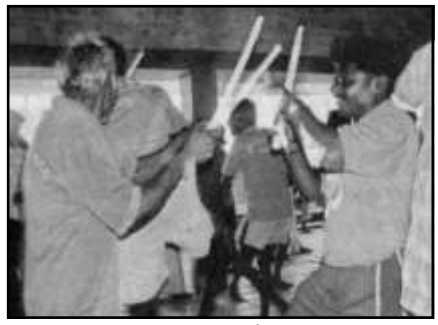
జై తాద్దిమిత కోలాటం

భూ ములన్నీ ఎండిపాయ బాపనమ్మ యాగిటాయ ఇంకన్న రారాద వానదేముడా చెరువులన్నీ ఎండిపాయ చేపలన్నీ చచ్చిపాయ ఇంకన్న రారాద వానదేముడా వంకాయ చెట్టోడు వంగొంగి చూసాడు బెండకాయ చెట్టోడు బెంగటిల్లిపోయాడు