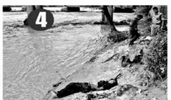
1. ఉత్తరాఖండ్ చమోలి జిల్లాలోని గోవింద ఫూట్లో చిక్కుకున్న యాత్రికులను రక్షిస్తున్న బడిబీబీ జవాన్లు 2. గారీకుండ్లోని మందాకినీ నదిలో చిక్కుకున్న గుర్రాన్ని తాడు సహాయంతో బయటకు లాగుతున్న స్థానికులు 3. తన తల్లిని ముందుగా హెలికాప్టర్లో తరలించాల్సిందిగా బ్రిటానిష్ వర్ణ జవానును వేడుకుంటున్న ఓ మహిళ 4. గంగా ఫూట్ సమీపంలో ఒడ్డుకు కొట్టుకొచ్చిన మృతదేహం