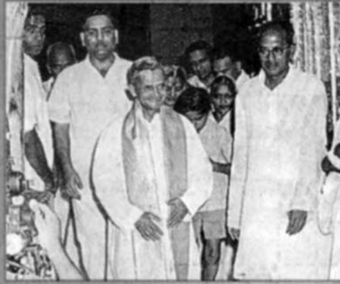
లాల్ బహదూర్ శాస్త్రి