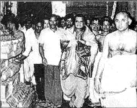
ఎన్ టి రామారావు