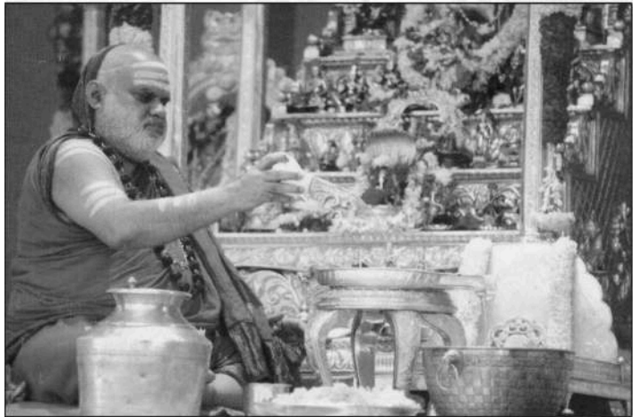
శ్రీరామనవమి రోజున శ్రీరామచంద్రస్వామివారిని అభిషేకిస్తున్న శ్రీ జగద్గురువు శ్రీశ్రీ భారతీతీర్థ మహాస్వామి వారు