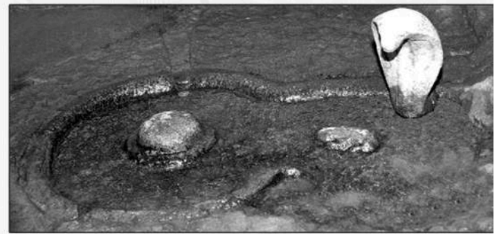
నిండు గర్భిణితో పున్న కప్పకు నీడనిస్తున్న నాగదేవత