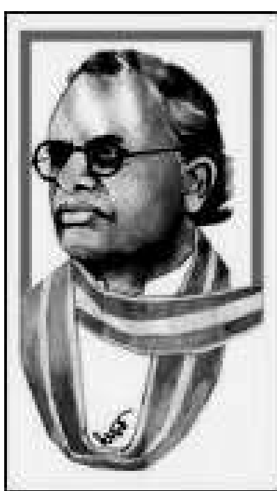
(తరువాతి 17 వ పేజీలో)

సుబ్రహ్మణ్యశాస్త్రిగారు పుట్టినది శోత్రియమైన కుటుంబం; నిష్టాగరిష్టమైన వైదిక సంస్కృతీ కుటుంబం. సనాతన ధర్మపరమైన సంస్కృతీపరమైన గ్రంథాలున్న తక్కు స్పృశించే అవకాశమే లేదు. యువత శిరోజాలను కుదించుకొనే క్రాఫింగుకు కూడా అనుమతించేవారు కాదు. పెద్దలు చొక్కాలను ధరించడానికి కూడా అంగీకరించేవారు కాదు. పై కందువా లేకుండా వచ్చేవారు కాదు. అలాటి సనాతనాచారం పాటించే కుటుంబంలో ఆయన కొన్ని సంప్రదాయాలను ధిక్కరించక తప్పలేదు.