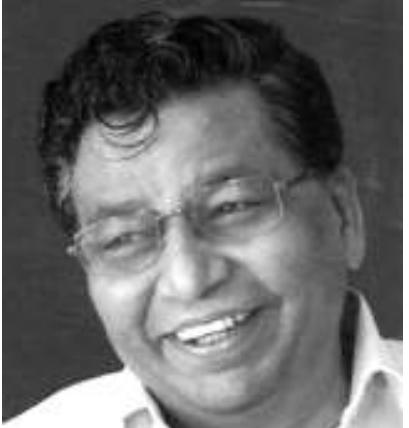
నవ్వుల రాయుడు నవ్వింపే రాయుడు 'గీతా'