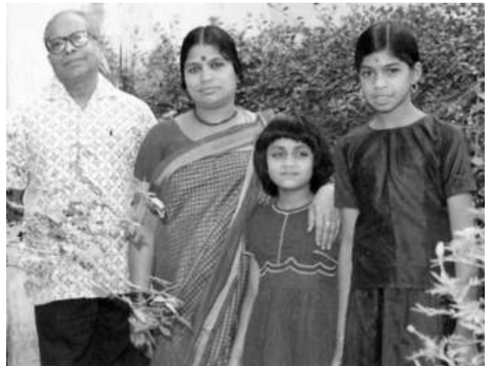
ఇద్దరు కుమార్తెలతో భీమన్న హైమ దంపతులు