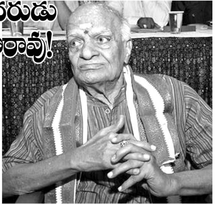
సినిమాల్లో ఎన్నో అవకాశాలు వచ్చినా, ఆయన అంతగా ఆ రంగప్రవేశం చేయలేదు. పైగా ఆకాశవాణిలో నాకు గౌరవప్రదమైన ఉద్యోగంలో ఉన్నాను. చలనచిత్ర రంగంలోకి అడుగుపెట్టడమంత ఆరోగ్యప్రదం కాదు. కానీ ఆయన స్వరమేళవింపులు అనుసరింపులూ చాలా తెలుగు చిత్రాల్లో వినిపించాయ్. వాహినీ వారి స్వరసీమలోని ఓహోహో పావురమా - అన్న పాట రజనీ స్వరకూర్చే అంటారు.

-విజయవాడలో 'రజని' శత సంవత్సర విభవమును వైభవంగా జరిపారు !!-