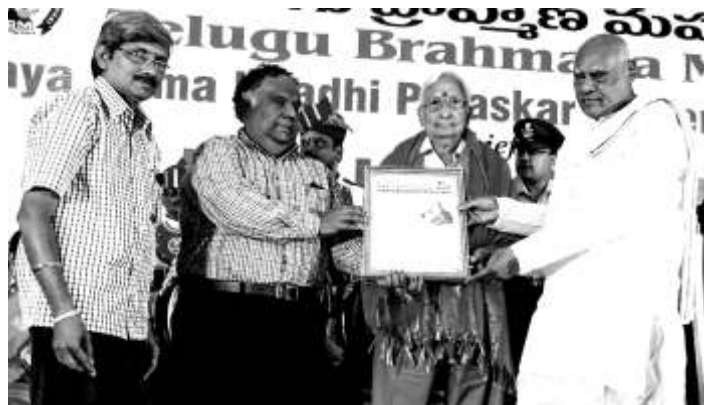
వ్యయేకృతే వర్ణతే ఏవనిత్యం విద్యాధనం సర్వధన ప్రధానమ్ - అన్నారు భర్తూహరి.

న చోరచోర్యం నచరాజహార్యం న బ్రాత్య భోజ్యం నచ భారకారి