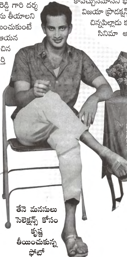
తేనె మనసులు సెలెక్షన్స్ కోసం కృష్ణ తీయించుకున్న ఫోటో