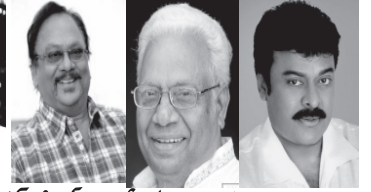
ఎన్.టి.ఆర్. జాతీయ అవార్డులు