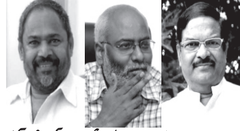
ఎన్.టి.ఆర్. జాతీయ అవార్డులు